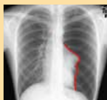
18歳男性の 原発性自然気胸 左肺が高度虚脱

気胸は肺がパンクしてしぼんでしまう病気です。中でも明らかな誘因なく発症するのが自然気胸です。原発性と続発性とがあり、前者は10代でタバコも吸わず基礎疾患も何もない若年者でも突然発症します。肺に気腫性肺嚢胞と呼ばれる風船状の病変が生じ、破裂して発症します。その明確なメカニズムはわかっておらず、なぜか原発性自然気胸は圧倒的に男性に多く、イケメンかどうかはさておき、若年で痩せ型体型の人に多く発症します。