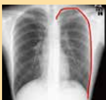
術後左肺はひろがり、 再発は認めて いない