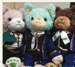
推し活グッズたち

総合受付は『病院の顔』とも言える場所であり、病院の第一印象を決めてしまう場面なので、患者さんには常に笑顔で接することができるように心がけています。そんな私ですが、仕事が終わるとたの☆プリンスさまっ♪のキャラクターを応援するために映画館へ直行する日々を送っています。映画館は『応援上映』という発声 OK の映画なので、両手にペンライトを持って推しを応援している時間は仕事で疲れた私を癒やしの時間へといざなってくれます。推し活をしていると周囲の人たちからは『毎日楽しそうだね』と羨ましがられます。ぜひ皆さんも推し活の世界に足を踏み入れてみてはいかがでしょうか（笑）