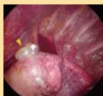
気腫性肺嚢胞から 空気漏れを認め、 これを切除