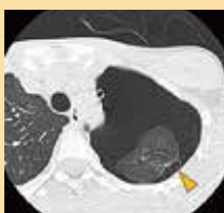
左肺に認めた 気腫性肺嚢胞