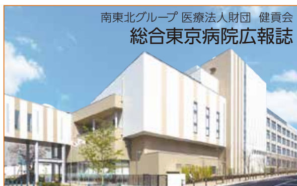
南東北グループ 医療法人財団 健真会 総合東京病院広報誌

医療連携支援センター 地域連携室 TEL: 03-3387-5444 編集・発行／総合東京病院 印刷／石井電算印刷株式会社