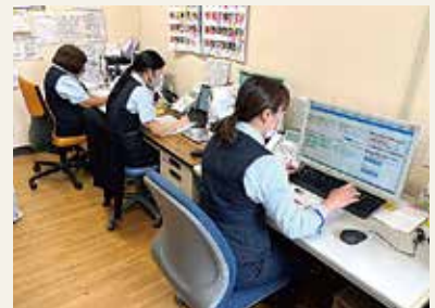
コールセンターの日常風景

スタッフ一同、患者様のご要望に迅速に対応できるよう、今後とも各部署の方々のご協力を頂きながら、業務を行ってまいります。