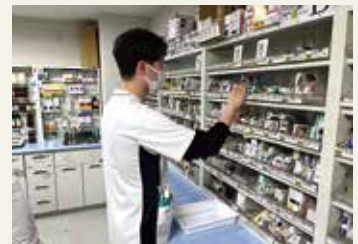
薬剤部内での調剤風景

私たちは3年目になり様々な業務を経験してきました。個々の患者さんに合わせた、さらに質の高い薬物治療をサポートできるよう、薬剤師としての知識を活かし日々努力していきます。