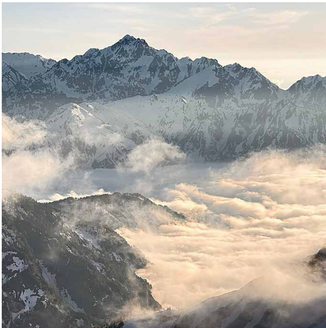
夕暮れの雲海と残雪の劔岳 by きなこ

医療連携支援センター 地域連携室 TEL:03-3387-5444 編集・発行/総合東京病院 印刷/石井電算印刷株式会社