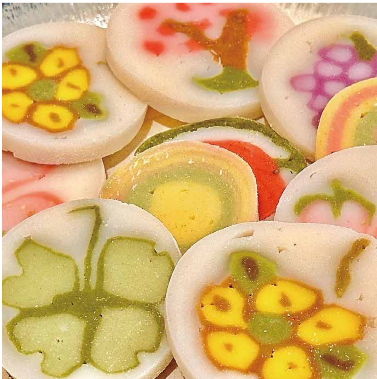
『やしょうま ー長野県の郷土料理ー』 by きなこ

医療連携支援センター 地域連携室 TEL:03-3387-5444 編集・発行/総合東京病院 印刷/石井電算印刷株式会社