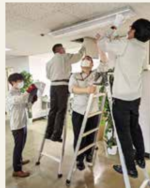
施設担当総出で作業する様子

「施設用度課」は本年1月に組織された新しい部署ですが、ここでは施設担当の業務を紹介いたします。施設担当は、病院の建物や土地、電気・ガス・給排水・医療ガス・電話等のインフラ設備の保全、空調・衛生・防災の各設備や機器の保守、清掃業務・警備業務の管理、送迎車両及び駐車場の管理、廃棄物の管理、設備・機器・建物の簡易な修理や営繕、関係業者の手配、各種法定点検、関係官公庁への申請・報告等、広範な知識と技術、体力が求められる業務などに従事しています。日々発生する課題は多様ですが、施設担当全員で協力し、日々コストダウンを心掛け“縁の下の力持ち”として当院を支えています。