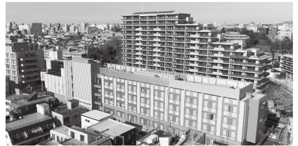
B棟と新しく建設されたマンション群

地域の皆様に信頼される病院をめざすため、昨年もさまざまなことに挑戦してまいりました。主なトピックスをご紹介します。1月には通所リハビリテーションがスタートしました。特徴は、身体機能の低下を予防するリハビリテーション機器を多数導入していることです。これらを積極的に活用し、在宅生活を総合的に支援します。