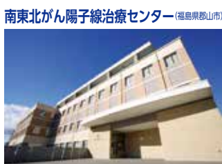
南東北がん陽子線治療センター(福島県郡山市)

TEL.024-934-5322(代) 〒963-8563 福島県郡山市八山七丁目115 FAX.024-934-3165 URL http://www.minamitohoku.or.jp E-mail : info@mt.strins.or.jp