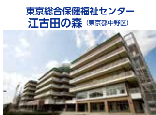
東京総合保健福祉センター 江古田の森 (東京都中野区)

TEL.044-322-9991 〒215-0026 神奈川県川崎市麻生区古沢都古255 FAX.044-322-8688 URL http://www.shinyuri-hospital.com/