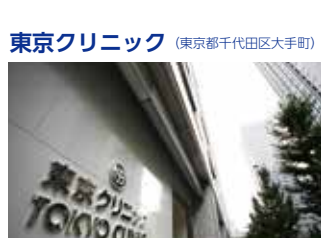
東京クリニック (東京都千代田区大手町)

TEL.03-5318-3711 〒165-0022 東京都中野区江古田三丁目14-19 FAX.03-5318-3712 URL http://www.kaigo-egota.com/ E-mail : egotanomor@mt.strins.or.jp