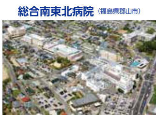
総合南東北病院 (福島県郡山市)

TEL.024-934-5322(代) 〒963-8563 福島県郡山市八山七丁目115 FAX.024-934-3165 URL http://www.minamitohoku.or.jp E-mail : info@mt.strins.or.jp