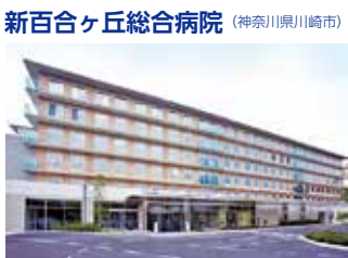
新百合ヶ丘総合病院 (神奈川県川崎市)

TEL.03-3387-5421 〒165-8906 東京都中野区江古田3-15-2 FAX.03-3387-5659 URL http://www.tokyo-hospital.com/ E-mail : tokyo-hospital@mt.strins.or.jp