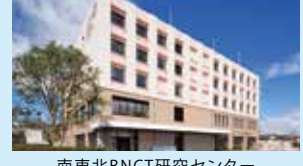
南東北BNCT研究センター