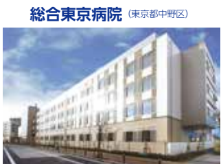
総合東京病院 (東京都中野区)

TEL.024-934-3888(代) 〒963-8563 福島県郡山市八山七丁目172 FAX.024-934-5393 URL http://www.southernthohoku-proton.com/