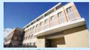
南東北がん陽子線治療センター

ご来場された方の中から抽選で、 PET健診モニター を募集致します。 モニターにご興味のある方は会場受付でお申し出ください。また、抽選にもれた方には 2割引優待券 を差し上げます。 ※PETと各種画像検査、血液検査を組み合わせ、がんの発見率をより高めることを目的とした総合的ながんドッグコースです。