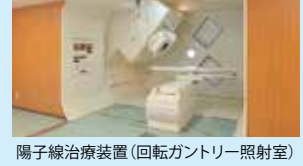
陽子線治療装置(回転ガントリー照射室)