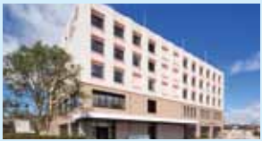
南東北BNCT研究センター