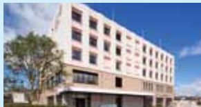
南東北BNCT研究センター