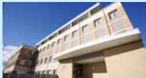
南東北がん陽子線治療センター

〈健診モニター内容〉 フルコース (PET、MRI、Eコー、血液検査、BMI) ※PETと各種画像検査、血液検査を組み合わせ、がんの発見率を より高めることを目的とした総合ながんドッグコースです。