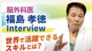
福島 孝徳 (福島孝徳脳腫瘍センター長)