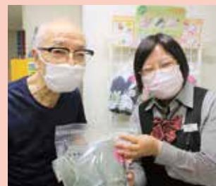
常連の患者さんと

プライベートではヨガを楽しみ仕事の活力にしております。小さなご要望でも耳を傾けてまいりますので何でも言っていただけると嬉しいです。スタッフ一同心からご来店をお待ちしております。