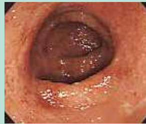
潰瘍性大腸炎の大腸