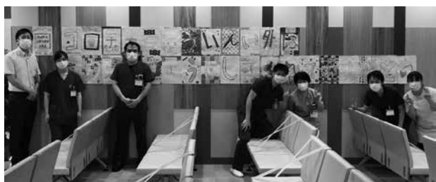
2つのプレゼントを院内に掲示