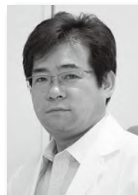
医療法人財団健貢会 理事長 総合東京病院 院長

ご来院のみなさん、いつも当院の感染対策にご協力いただきありがとうございます。当院では職員が一丸となり、感染拡大を防ぐための対策を行っています。私自身、職員の働きにはとても感謝しています。これからもすべては患者さんのために努力して参ります。