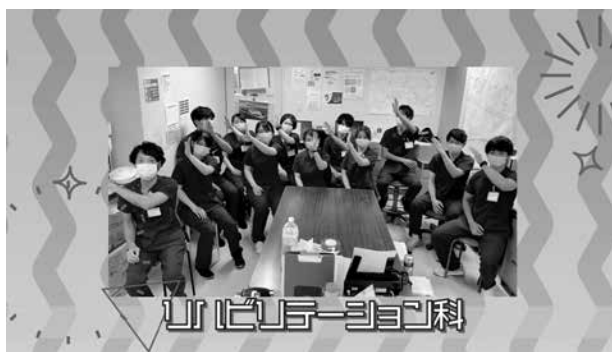
多職種が参加したお礼動画の制作